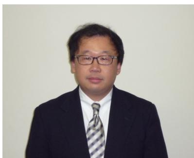
会計プロフェッション研究科 研究科長