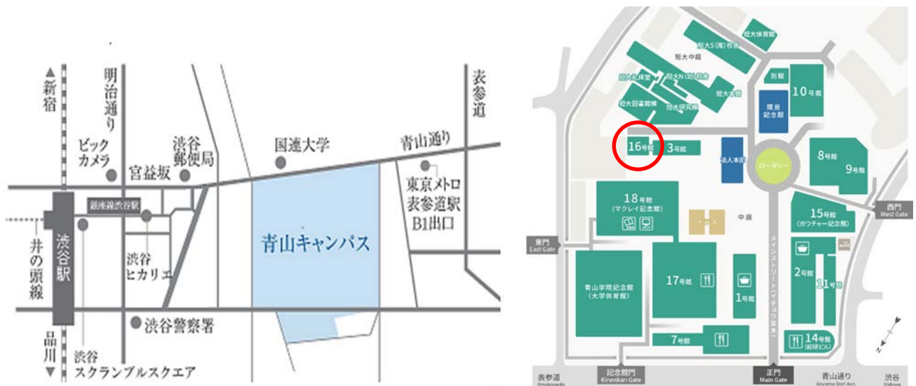
青山キャンパス建物配置